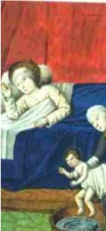
Рождество Богородицы, французская школа XV в.

Само их присутствие рассматривалось как неопровержимый и окончательный признак ереси. «Что среди них есть женщины, и они претендуют на то, чтобы проповедовать и отпускать грехи. Но это достойно осмеяния, потому что апостол Павел, наоборот...»